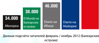
Данные подсчёта читателей февраль / ноябрь 2012 (Балеарские острова)

Распространение основывается на трёх локальных изданиях: на Майорке, на Менорке и на Ибике и Форментере.